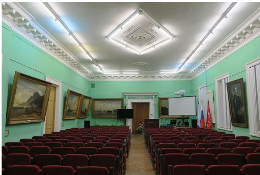
Зал Боголюбова А.П. Военно-морского института