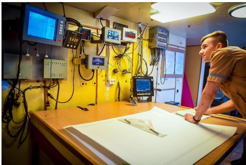
Практика на учебном корабле