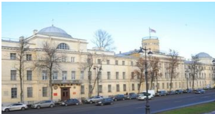
Фасад здания Военно-морского института

В настоящее время учебное заведение представляет собой уникальный комплекс объектов культурного наследия. Это морские памятники, мемориальные комплексы (Морской храм, памятники, бюсты, стелы и др.), исторические модели кораблей, историческое здание на берегу Невы, достопримечательные места, связанные с морской историей и морской славой, с историей освоения новых территорий и жизнью выдающихся мореплавателей, морские коллекции, архивные и библиотечные собрания, военно-морские ритуалы и церемонии, морские традиции мореплавания, фольклор, традиционные знания и многое другое.