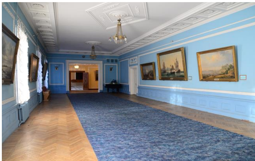
Картинная галерея (Голубая гостиная) в главном здании института