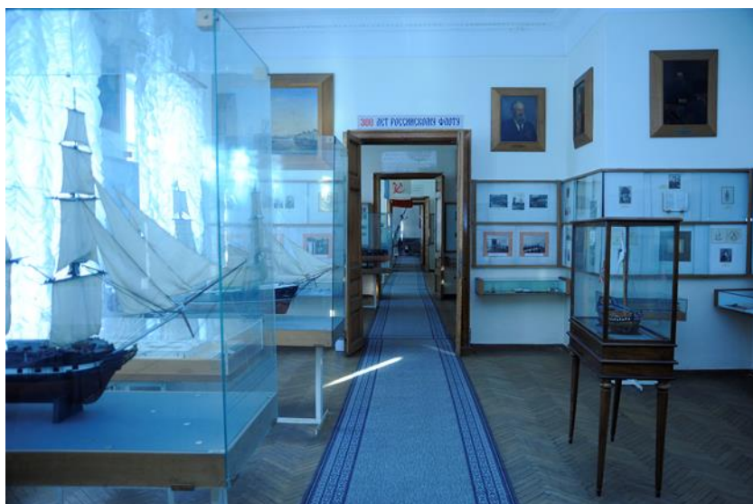
Музей Военно-морского института