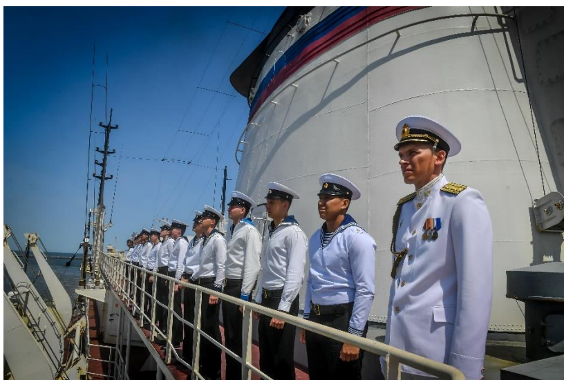
Заход в иностранный порт